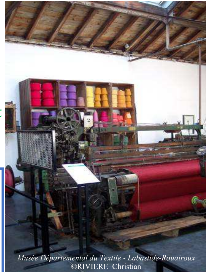
Musée Départemental du Textile - Labastide-Rouairoux

Sur l'ensemble des sites, le port du masque à partir de 11 ans, le respect des distances physiques et les gestes barrières sont obligatoires.